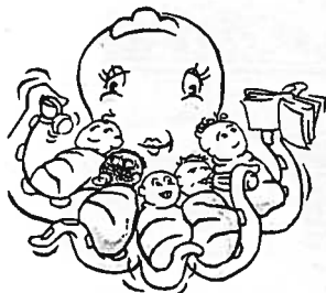
Leçon n°1 : La récupération

Pensez à en parler autour de vous à des recrues possibles. Cela nous permettra d'assurer plusieurs catégories sereinement, et pensez, entre autres, à l'amateur stressé par les feuilles de matches : il a tellement envie de faire une belle saison avec toute la bande!