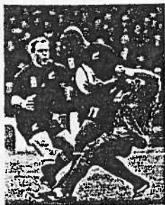
Lomu en action...

Parce que je m'inquiète de l'uniformisation du jeu qui a fait disparaître les « centres créateurs » au profit des mastodontes (désolé Dub, dans mon équipe-type, France - Reste du Monde, tu n'es pas au centre, mais je ne t'en veux pas).