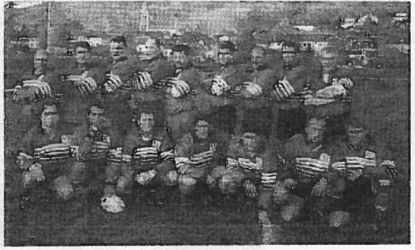
L'équipe de Garches réalise une excellente première partie de saison en Première série.